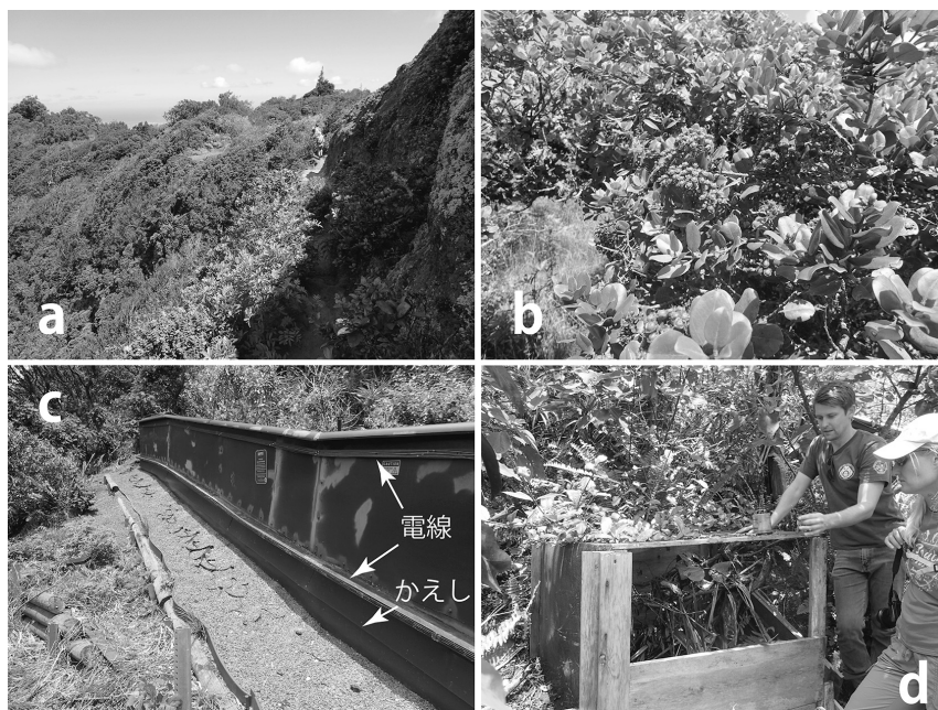
図3：(a) 野外施設があるワイアナエ山系の稜線上の景観。(b) オヒアレファ (ハワイフトモモ)。樹上性カタツムリが好む植物の一つ。(c) 外側から見た外来種排除柵。ヤマヒタチオビの侵入を防ぐために柵の下部に鉄板のかえしがあり、さらにその上に電圧をかけた銅線を取り付けてある。電源は太陽光パネルでまかなわれている。柵の高さは1.3m。(d) 個体数の少ない種を管理する木箱ケージ。写真では中を観察するため金網が外されている。

植によって森林が開拓され、生息地が縮小しました。それに追い打ちをかけ、現在も続く脅威は外来種による捕食です。その二大巨頭はネズミ類（ドブネズミやクマネズミなど）と、ヤマヒタチオビ ( Euglandina rosea , 図1 a) という肉食性のカタツムリです。ネズミ類はポリネシア人や欧米人とともに入り込んだものですが、ヤマヒタチオビはやはり外来種のアフリカマイマイ ( Achatina fulica ) を駆除する目的で1955年に意図的にハワイに移入されたものです。ただ、実際にはアフリカマイマイの駆除にはほとんど効果がなく、固有カタツムリを捕食するという被害が現れました。また、1970年代にペットとして持ち込まれ野生化したアフリカ原産のジャクソンカメレオン ( Trioceros jacksonii xantholophus ) や、陸生扁形動物のニューギニアヤリガタリクウズムシ ( Platydemus manokwari ) も、ハワイ在来のカタツムリを捕食しています (Chiaverano & Holland, 2014)。これらの人的な要因により、750種のうちの少なくとも65%は絶滅した可能性があると考えられています (Régnier et al., 2015)。ちなみに、ニューギニアヤリガタリクウズムシは小笠原諸島にも持ち込まれ、やはり固有カタツムリを捕食して深刻な被害をもたらしています (千葉, 2017)。